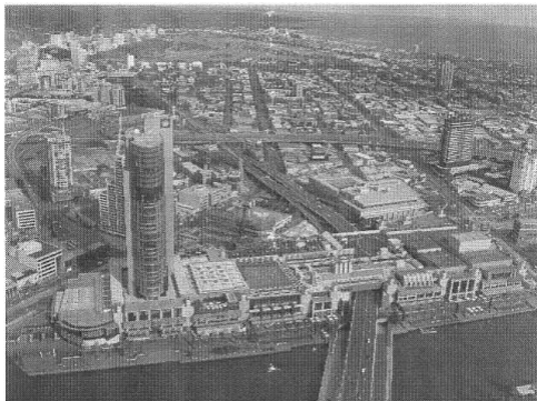
Vue Aérienne de Melbourne (Australie)

Pour régler vos cotisations et être membre de l'ARAETG, une seule adresse : F5JMH Alain THEBAULT La Bordeneuve 82120 MANSONVILLE Le meilleur accueil vous sera réservé. Cotisation : 9,15 € /an, paiement par chèque uniquement